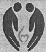
DIAGRAMA HORARIO II JORNADAS DE ENFERMERIA del HOSPITAL HELLER NOVIEMBRE 2017